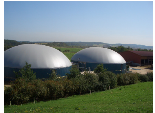
Fachtagung der Bauakademie Sachsen mit: